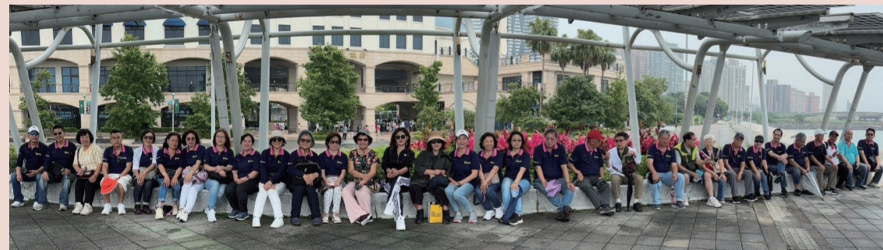
大家一整排坐，也可以排成一個「V」字型的「勝利」隊形。