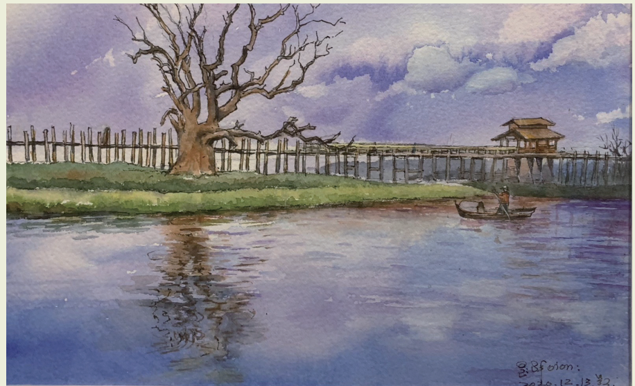
有百年歷史的吳本橋是由緬甸柚木搭建而成的瓦城光觀勝地地標之一。