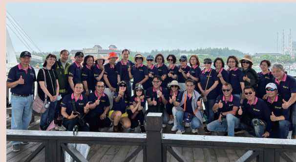
因為下雨，這張合照，就成了「天作之合」了。