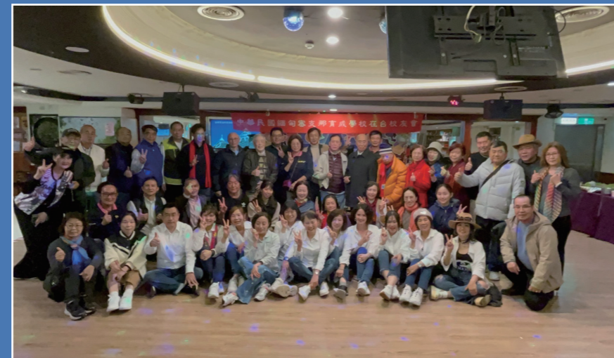
關鍵的時刻，大合照是一定要的