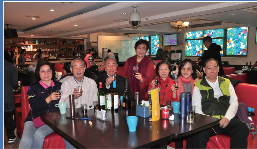
元老級的學長姊們一起見證交接傳承