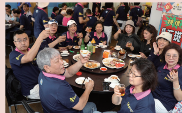
吃飯，人對了，味道也就對了。