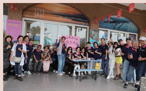
春遊活動報到處，滿滿的大媽哥及燦爛的笑容。心情也就「high」起來了！