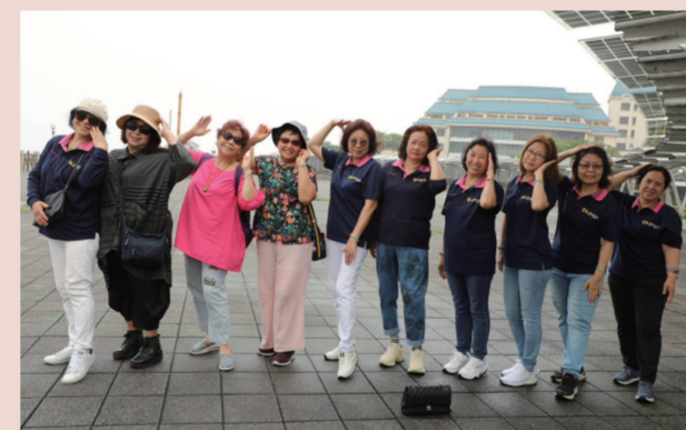
不管是左手還是右手，絕不是搔首弄姿，……她們都是婀娜多姿！