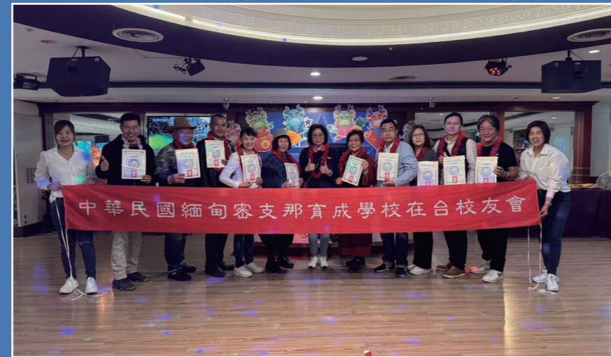
嚴肅的交接典禮，也可以融入歡樂愉悅的氛圍