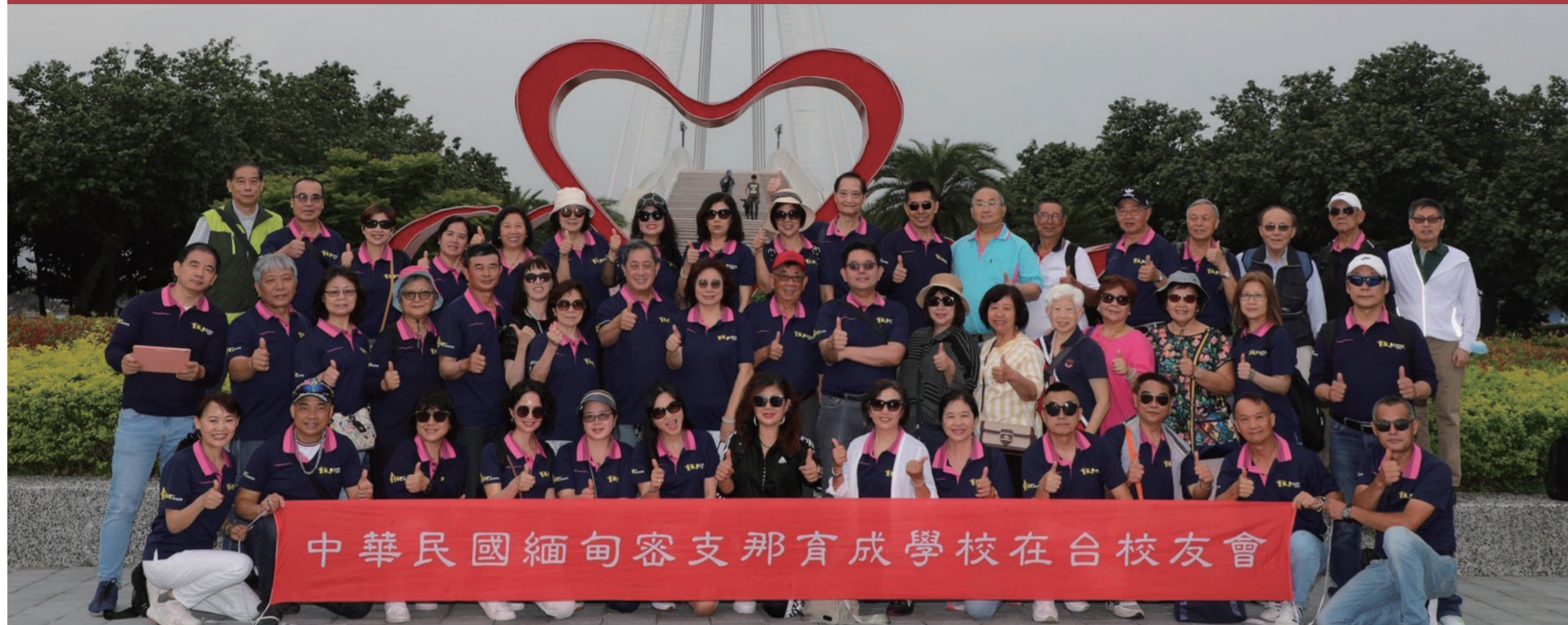
中華民國緬甸密支那育成學校在台校友會

本會於2024年5月5日舉辦春遊活動，景點包括淡水漁人碼頭情人橋、紅毛城、小白宮、淡水老街。早上8:40遊覽車從新北市南勢角出發，經台北市圓山捷運站，再到漁人碼頭情人橋前廣場與自行開車的校友會合。