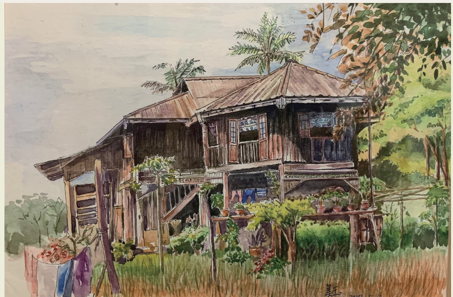
緬甸高腳木屋，現在很少看到了…