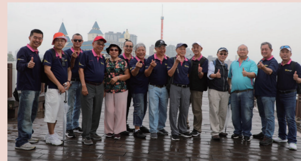
河堤木道上，下雨把育成的伙伴聚集得更緊密了。