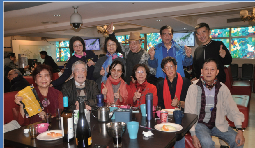
老中青三代同堂，在歡樂的歌聲中薪火相傳