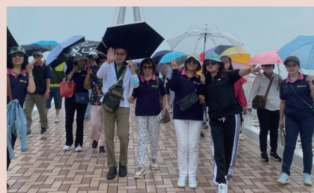
天空開始飄雨，本來自由活動，應該是三三兩兩的，……因為下雨，讓所有的兩兩，靠得更近了。