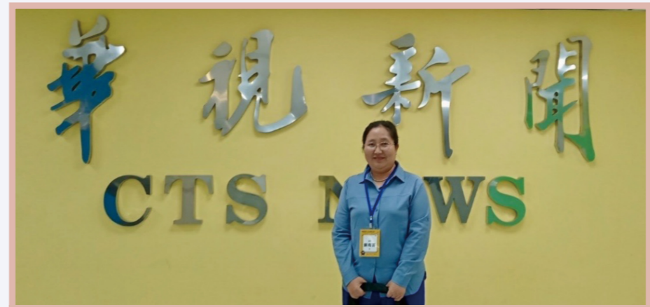
筆者參訪華視拍照留念

期間曾到華視參訪，正逢台灣立法院正副院長選舉，志工們參觀播報現場與業界新聞工作者的日常。了解到連線記者的溝通必須簡潔、快速、精準，導播則要眼觀四面、耳聽八方。參訪過程中對台灣現今的新聞環境有了全新的認識，見證臺灣的民主、自由及繁榮，使我獲益良多。