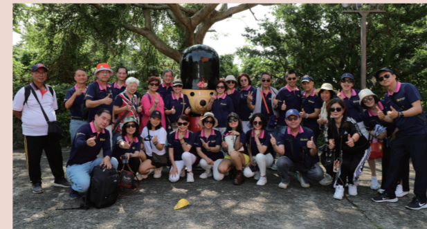
紅毛城的景點，有些爬坡，甚至還要上樓下樓，是有點累人，大樹下，歇息一下，就來個合影吧。