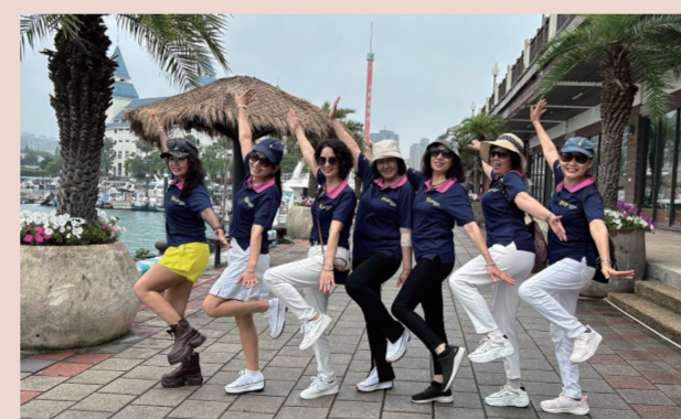
這個姿勢整齊嗎？至少腳步是一致的。